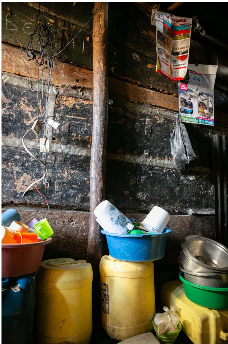
Zu Hause bei Rosie Naigaga

bleibt für Rosie Naigaga alles, wie es ist – Tag für Tag